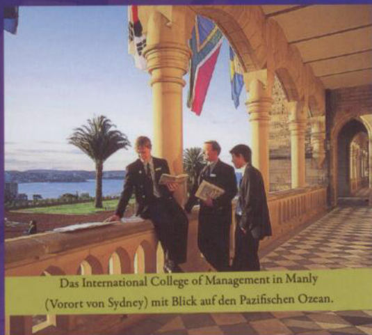
Das International College of Management in Manly (Vorort von Sydney) mit Blick auf den Pazifischen Ozean.

fessor reden. Dank einer Open-Door-Policy, intensiver Evaluation und Einjahresverträge der Profs kann man in Australien sehr gute Bildung erwarten. Studenten aus dem Ausland werden vom australischen Unisystem richtig aufgefangen – mit u.a. einem Abholservice am Flughafen oder mit universitätsinternen Accomodation - und Job - Offices. Studenten aus Deutschland sind übrigens bei australischen Professoren besonders beliebt. Bei allem Enthusiasmus – oft sammeln sich Bedenken im Kopf eines Studis mit Fernweh: Die Multidimensionalität, eine Studienzeit im Ausland zu organisieren, erscheint oft übergroß.